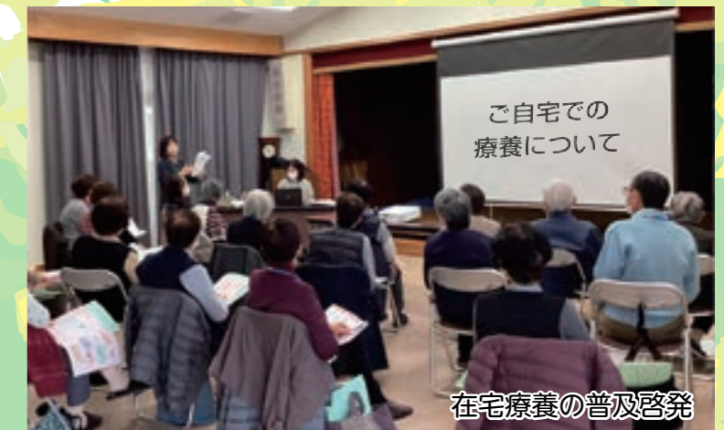
在宅療養の普及啓発