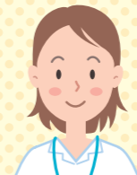
医療ソーシャルワーカー