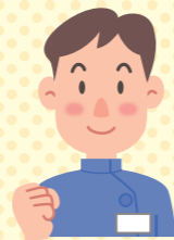
理学療法士 作業療法士 言語聴覚士