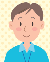
いきいき支援センター (保健師・ケアマネジャー・社会福祉士)