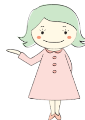
中北マナーキャラクター 中北 みどりちゃん