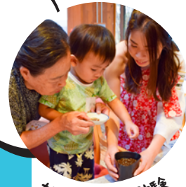
ガーデニング体験