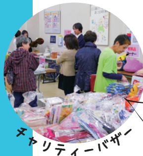
チャリティーバザー